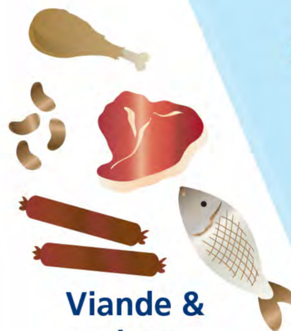
Viande & poisson