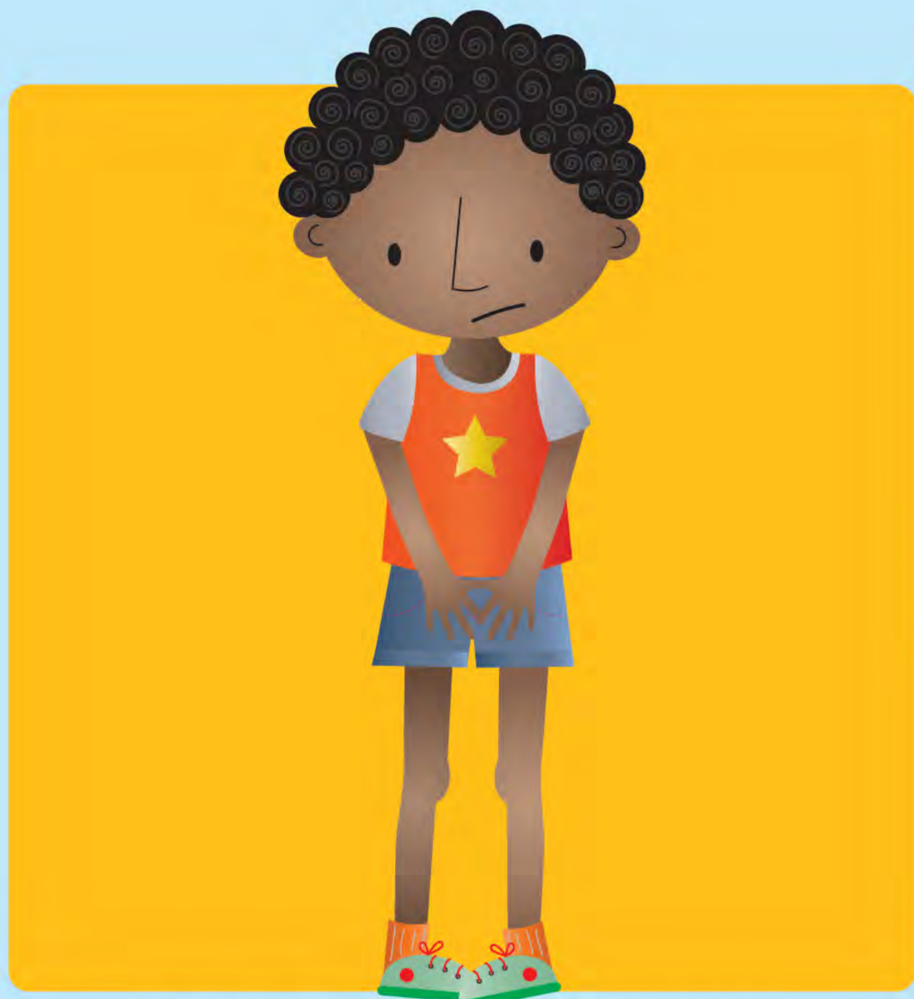
Envie fréquente d'uriner

Contactez un docteur ou une infirmière si votre enfant présente l'un de ces signes